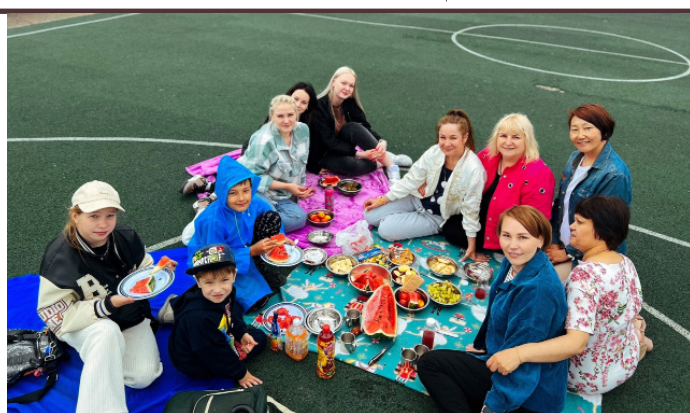
«Семейный завтрак на траве» с Движением Первых

Забайкальский район представляла команда «Юность», которая по итогу двух дней борьбы заняла 8-ое место среди 26-ти команд Забайкальского края.